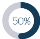
Collège des collectivités territoriales, de leurs groupements et des établissements publics locaux

• La composition de la CLE est arrêtée par le Préfet responsable de la démarche SAGE et inclut : des élus locaux (au moins 50%), des usagers (au moins 25%) et l'État et ses établissements publics .