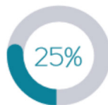
Collège des usagers, des propriétaires fonciers, des organisations professionnelles et des associations