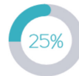
Collège des services et établissements publics de l'État

• La CLE est renouvelée dans sa totalité tous les 6 ans, sa composition peut être partiellement modifiée à la suite d'élections électorales ou professionnelles.