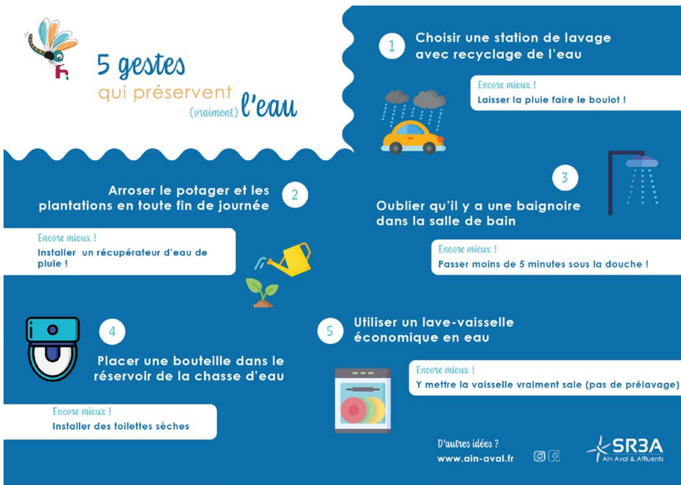
Photo N° 8 - à utiliser en format paysage ou portrait